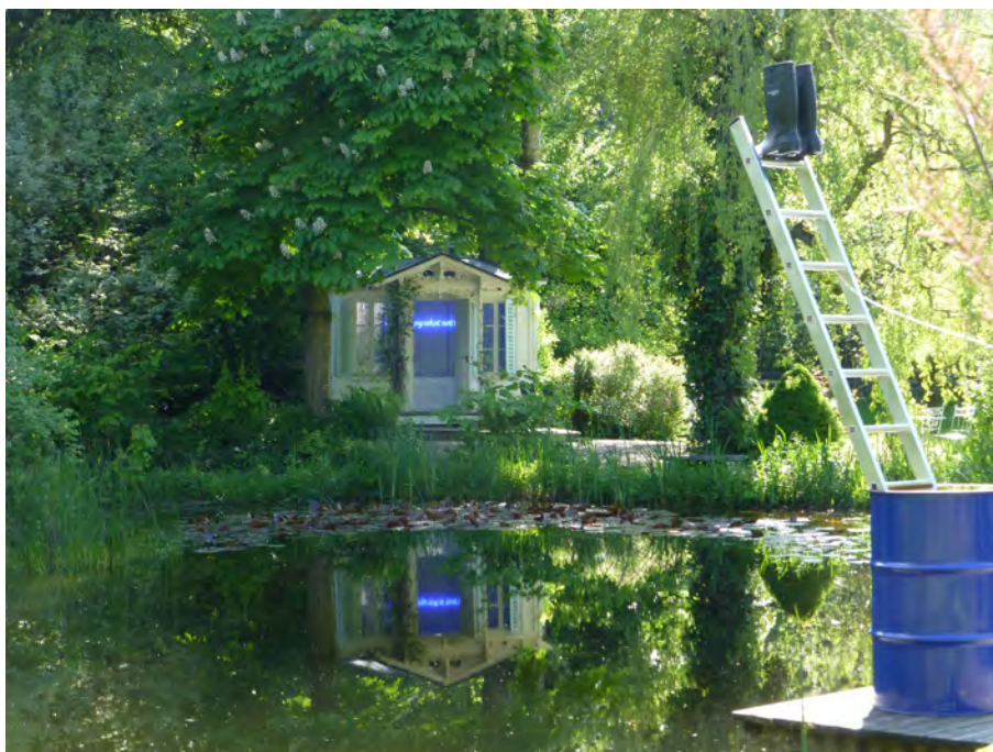
Roman Signer, Maurizio Nannucci